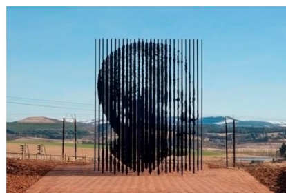
Marco Cianfanelli, Release (Soltura), 2012, África do Sul, aço pintado e cortado a laser, profundidade 20,8 m, altura 9,48 m e largura 5,19 m.

As imagens apresentam, de diversos ângulos, a escultura de Marco Cianfanelli em homenagem ao 50º aniversário da captura e prisão de Nelson Mandela, em 1962. A obra é composta por hastes de aço de altura variável, cortadas a laser e inseridas na paisagem, na província de KwaZulu-Natal, onde Mandela foi detido pelo regime do apartheid . Ao comentar a sua obra, o artista afirmou: "As 50 colunas representam os 50 anos que se passaram desde a sua captura, mas também sugerem a ideia de que muitos compõem um conjunto; referem-se à solidariedade. Indicam a ironia de que o encarceramento de Mandela o transformou em um ícone de luta, alimentando a resistência que levou o país à democracia".