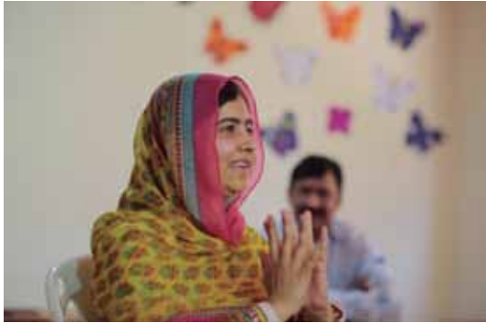
Nobel Peace Prize laureate Malala Yousafzai gestures inside a classroom at a school for Syrian refugee girls, July 12, 2015.

Sylvia Westall July 13, 2015 Bekaa Valley, Lebanon