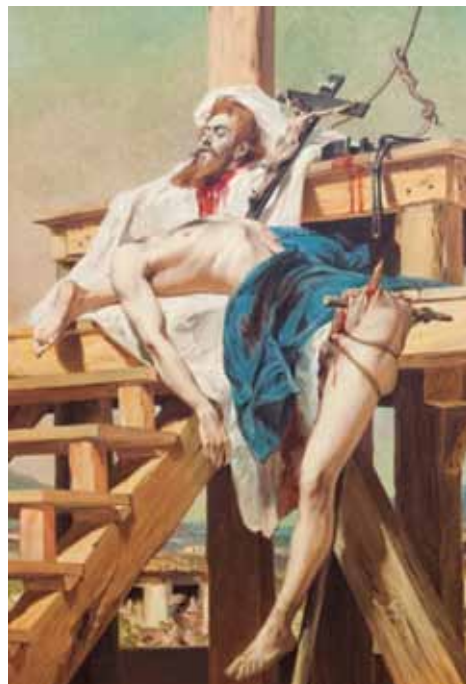
(Pedro Américo. Tiradentes esquartejado , 1893. Museu Mariano Procópio, Juiz de Fora.)

A conhecida pintura de Pedro Américo (1840-1905) remete a um fato histórico relacionado à seguinte escola literária brasileira: