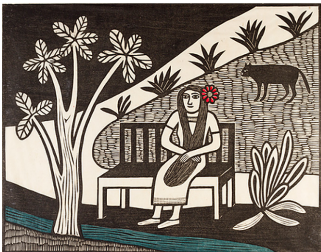
A Louca do Jardim (Gilvan Samico, 1963)

Em relação ao Movimento Armorial, é correto afirmar que