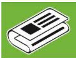
Lab. de Jornalismo

Associação civil, sem fins lucrativos, formada e gerida essencialmente por alunos de graduação dos cursos de Administração, Relações Internacionais e Publicidade e Propaganda, os quais prestam serviços de consultoria e desenvolvem projetos para empresas nas suas respectivas áreas, com nível profissional.